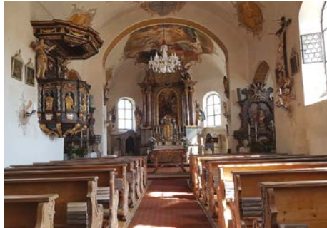
Quelle: Wikimedia Foto: Ricarda St. Lizenz: Creative Commons By-SA 4.0

stroms an Wallfahrern wurden Ende des 17. Jahrhunderts die beiden Seitenkapellen angebaut. Der sehenswerte Innenraum mit Deckenfresken aus dem Jahr 1760 in dem tonnenförmigen Saalbau zeigen im Chor die Verkündigung Marias und im Langhaus die Himmelfahrt Marias.