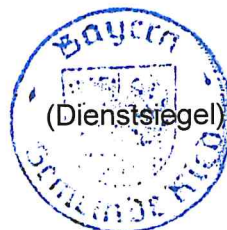
Erwin Gerstlacher Erster Bürgermeister