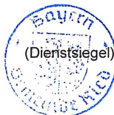
Erwin Gerstlacher, Erster Bürgermeister