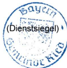
Erwin Gerstlacher Erster Bürgermeister