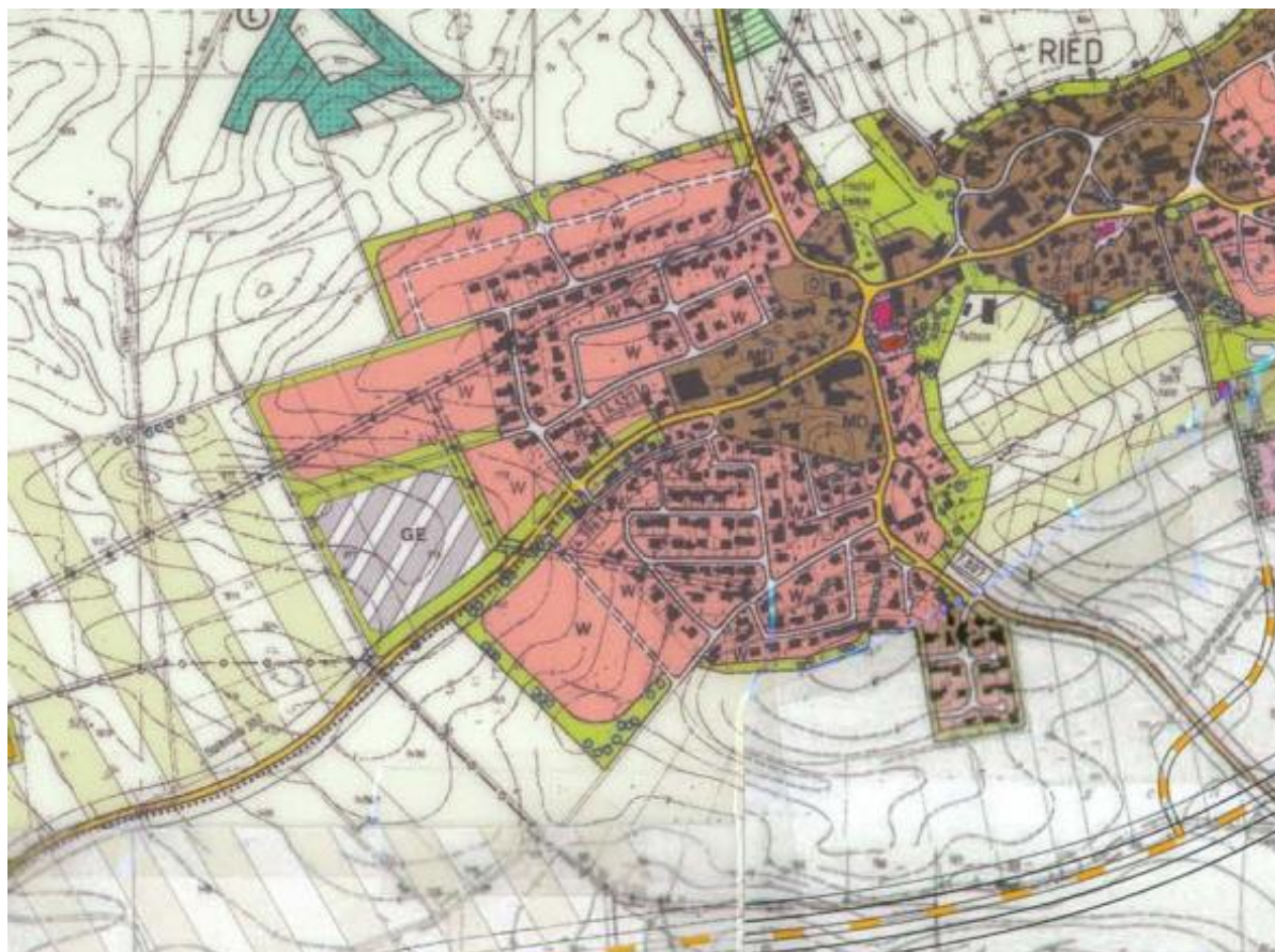
Abbildung 2: Ausschnitt aus dem rechtswirksamen Flächennutzungsplan (ohne Maßstab)

Der wirksame Flächennutzungsplan der Gemeinde Ried aus dem Jahr 1999 wurde bisher 16-mal geändert. Er stellt die Änderungsfläche im Nordosten als Wohnbaufläche und im Südwesten als landwirtschaftliche Fläche dar. Zwischen den Bereichen liegt eine Grünfläche.