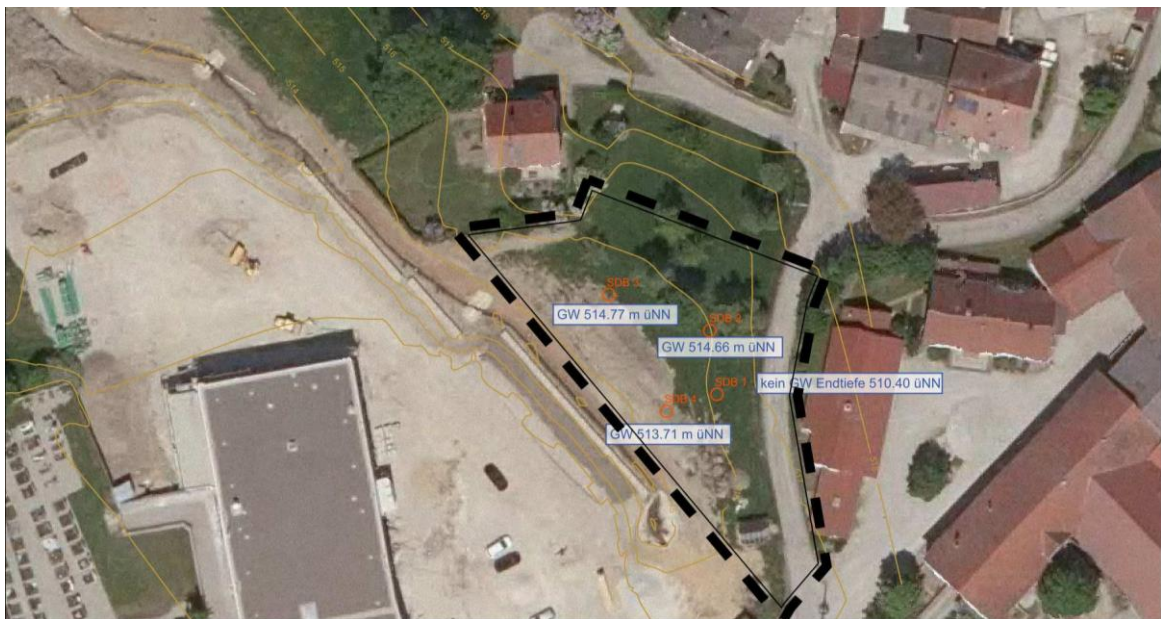
Ermittelte Grundwasserstände (Chrysal Geotechnik 2021)

An einer Bodenprobe wurde eine Belastung des Bodens mit 1,7 mg/kg Cyanid festgestellt. Der belastete Boden ist demnach als Z1.1- Material einzustufen.